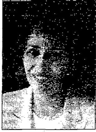
سمو الاميرة بسمة

عمان - بتر - اكدت سمو الاميرة بسمة ان التعاون بين مختلف المنظمات النسائية غير الحكومية وتكاتف جهودنا هو عامل حاسم في تحقيق الاهداف والغايات التي نؤمن بها وتسعى الي تحقيقها.